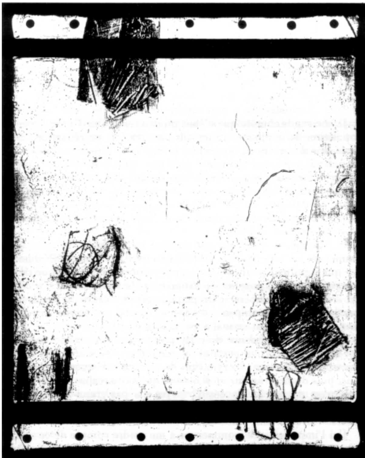
M. J., Mille morceaux , 1986, 25 x 25 cm, technique mixte sur toile